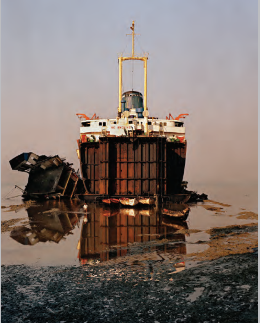
Shipbreaking #31, Chittagong, Bangladesh Edward Burtynsky 2001