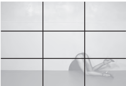
Charles Jourdan Kampagne Guy Bourdin Frühling, 1979