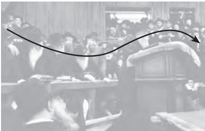
Der Rebbe Marc Asnin 1992